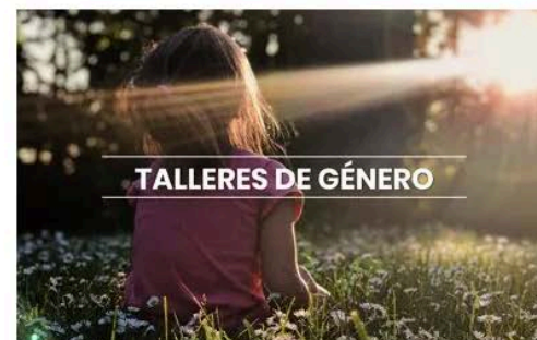
TALLERES DE GÉNERO