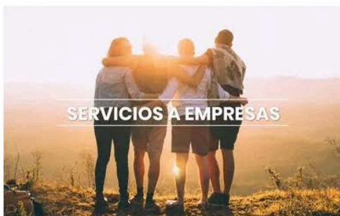
SERVICIOS A EMPRESAS